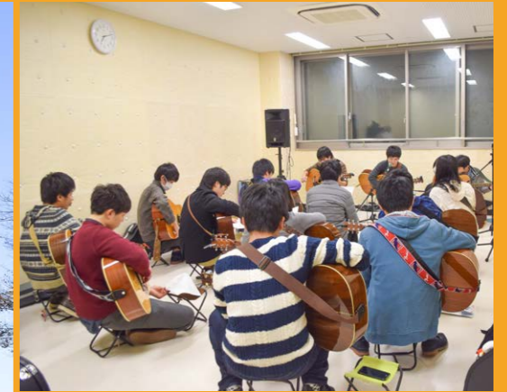
(左) 川内ホールの外観 (上) 川内ホールでの学友会 ブルーグラス同好会の練習風景