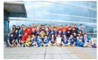
全日本大学フットサル大会で優勝した学友会フットサル部