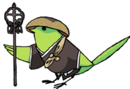
大会公式マスコット 「ホケキョ坊」