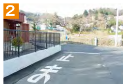
2 保育園の玄関付近では、園児の安全確保のため、十分注意して通行しましょう。