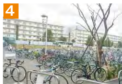
4 キャンパスの出入口通路にはみ出して駐輪しないで下さい。満車の際は空いている他の駐輪場を利用しましょう。