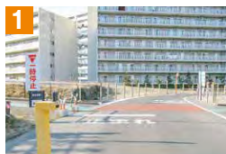
1 遊歩道との交差点です。必ず一時停止を行いましう。

また、次の5箇所は歩行者や自動車との接触など危険箇所なので、通行するときに十分注意しましょう。