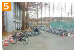
5 体育館利用者の通行のため、体育館玄関前には駐輪しないようにしましょう。