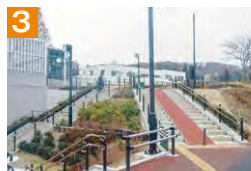
3 市道から駐輪場へは、階段中央のスロープを利用し自転車を引き上げて下下さい。降りる際も必ず自転車を引き上げて利用して下さい。