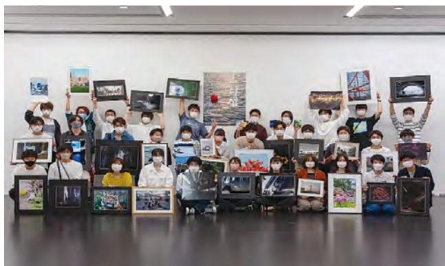
▲学友会写真部の活動風景

写真部の活動は3本柱、撮影会、例会、写真展で成り立っています。まず1つ目は撮影会。その名の通り撮影会では、様々なところに出向き、カメラを構えて練り歩きます。次に2つ目の例会では、各自が撮影した写真を持ち寄って感想を述べ合います。そして3つ目は写真展です。年に3回のメインイベントであり、こだわりを込めた写真作品を展示しています。機材や被写体には部員それぞれの個性が色濃く出ており、多様な写真を楽しんでいただけます。作品については、デジタルカメラとフィルムカメラの両方で撮った作品を扱っています。とくにフィルム作品は、暗室で現像から焼き上げまで行なっており、近年少なくなっているフィルム写真をご覧いただける貴重な機会でしょう。