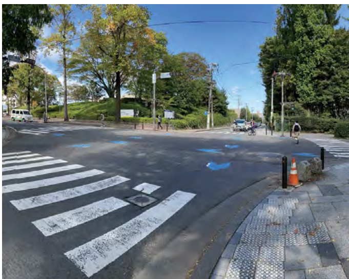
▲仙台二高前の交差点

「歩行者専用現示方式」は、すべての方向の自動車等を同時に停止させている間にすべての方向の歩行者等を同時に横断させる方式であって、斜め方向の横断を認めないものをいいます。また、自転車が歩行者用信号に従って横断する際にも、自転車から降りて横断してください。これからも東北大生としての責任を自覚し、交通ルールをしっかりと守って、安全に利用しましょう。