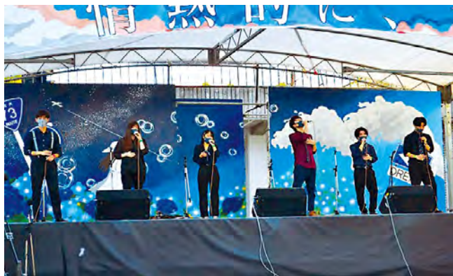
▲学友会アカペラコーラス部の活動風景

年間行事については、年2～3回行われる部内ライブ、最も多くのバンドが演奏を披露する学祭、選考会を勝ち抜いたバンドのみが参加できる定期演奏会・Winter Liveなど、様々なライブがあります。他にも外部のイベントや大会への出演を目指すバンドも多数あり、音楽を楽しみたい人から音楽を突き詰めて上手くなりたい人まで幅広く活動できます。