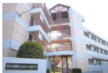
▲国際交流会館東仙台会館 ▲国際交流会館三条第二会館