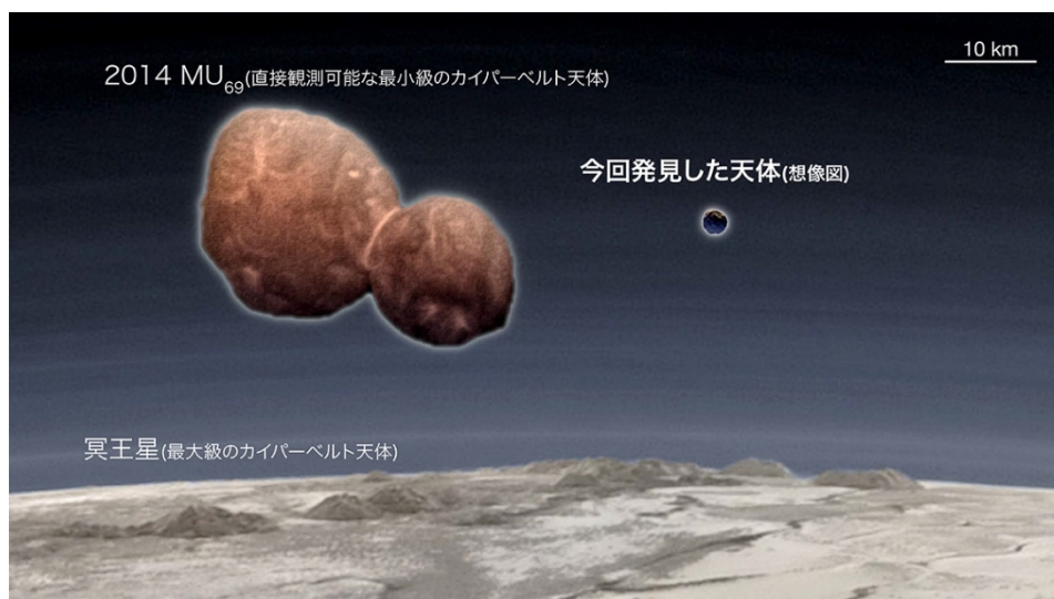
[図2] 今回発見されたカイパーベルト天体（半径およそ 1.3km）の想像図と、主要なカイパーベルト天体との大きさの比較。図中では直接観測によって発見された既知のカイパーベルト天体の中で最大級のサイズを持つ冥王星（半径 1185km）および最小クラスのサイズを持つ「2014 MU69」（ニューホライズンズが探査した天体、長径およそ 30km）を比較対象に示す。いずれの天体も今回発見されたような微小な天体が衝突・合体を経て成長した姿であると推定される