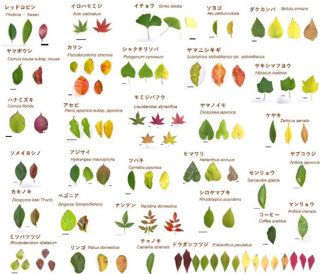
図 2. センサの機能テストに用いた約 30 種の植物葉。安価な小型センサでも、高精度の分光器と同様の精度で多様な色の葉を計測できることを確認しました。