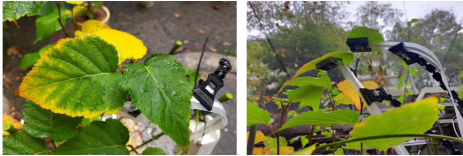
図 1. 植物の葉の裏に直接取り付けられるセンサ。葉の裏側に取り付けることで、光を遮らず、精度の良い測定が可能となりました。野外で観測したデータは端末からリアルタイムに見ることができます。