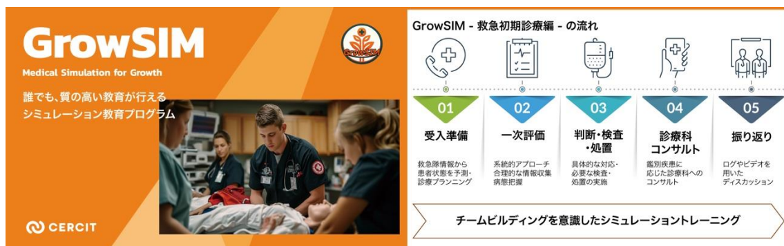
GrowSIM(グロウシム)～救急初期診療編～

CERCIT は、東北大学の医療教育機関であるクリニカル・スキルスラボ (注2) を母体とする東北大学発ベンチャーです。「新たな医療福祉教育の創造と普及を通じて、全ての人の学びと健康に貢献する」ことをミッションに掲げ、医学生や医療従事者の教育、企業との共同研究開発などの経験と知財を社会に還元するサービスを展開しており、麻酔医療教育アプリの社会実装化も支援しています。また、これまでに医療シミュレーションプログラム「GrowSIM(グロウシム)～救急初期診療編～」 (注3) を開発・販売しています。