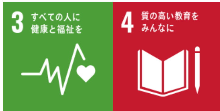
本取り組みにおける SDGs の目標

東北大学、テンダ、CERCIT の産学連携により、医療分野の学習・研修に役立つプラットフォームの実現を目指し、教育現場でのアプリ検証と改善を進め、医療教育のさらなる発展に貢献します。また、本取り組みを通じ、IT の力で東北地域の医療および医療教育への貢献を行うとともに、SDGs の目標である「3.すべての人に健康と福祉を」および「4.質の高い教育をみんなに」の達成にも貢献いたします。