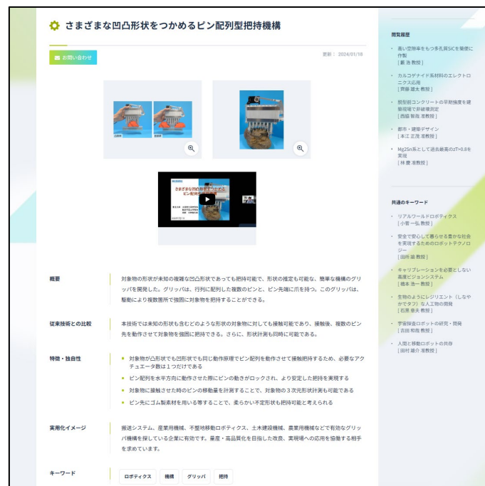
図 2. 研究シーズ詳細画面。研究の概要が専門外の方でも理解できるようコンパクトにご紹介しています。