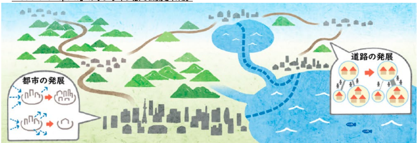
図1 都市と道路網の共発展シミュレーションモデルのコンセプト図

本成果は2022年6月16日（米国東部夏時間）にネイチャー・パブリッシング・グループの総合科学雑誌「Scientific Reports」のオンライン版で公開された。