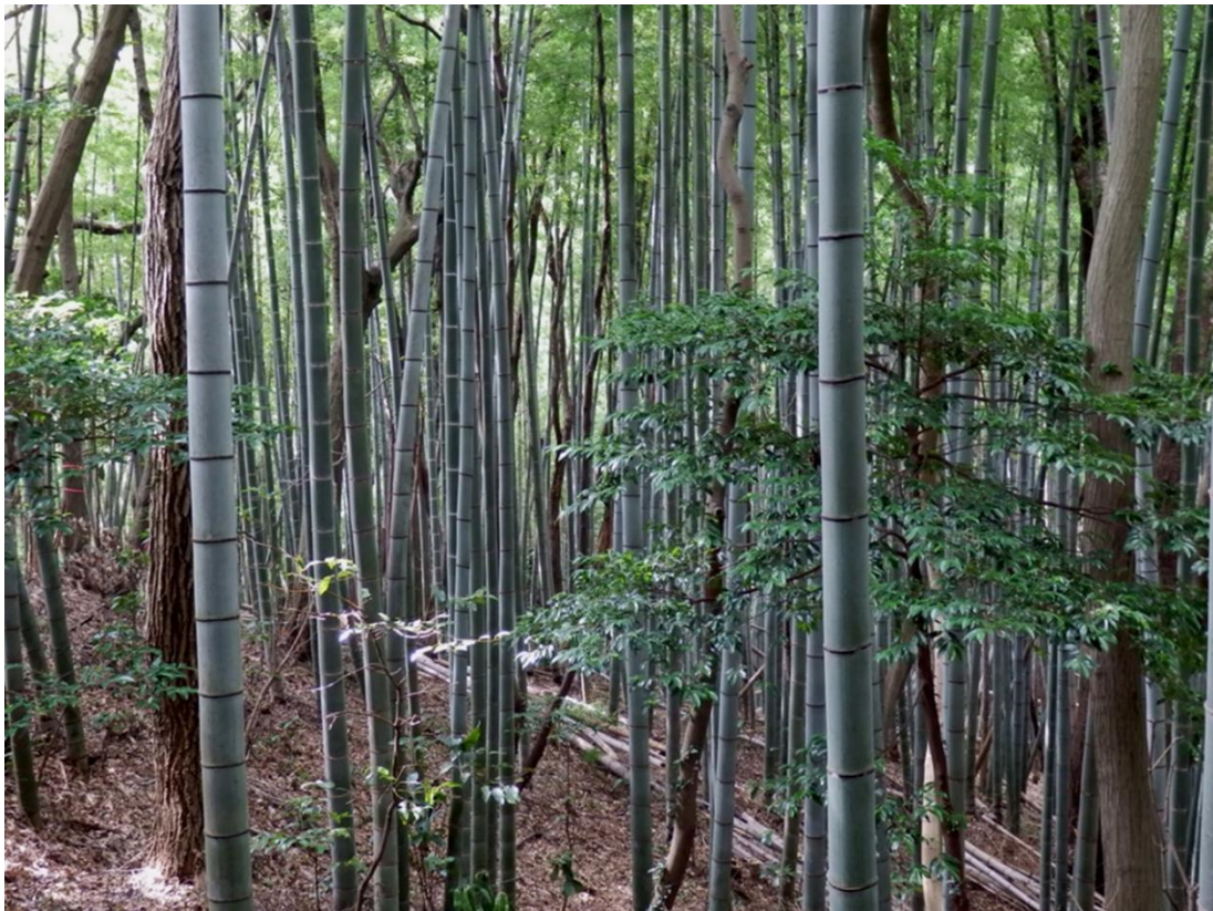
図1. 里山の雑木林に侵入していく竹林 (神奈川県逗子市)

現在、モウソウチクを始めとするマダケ属のタケは、環境省と農林水産省が作成した生態系被害防止外来種リストで産業管理外来種(産業又は公益的役割において重要であるが、利用上の留意事項が求められるもの)に指定されています。マダケ属は温かい地域が原産だと考えられており、放棄竹林は現在では主に西日本で問題となっていますが、気候変動・温暖化が進むと、東日本や北日本でも竹林が定着し、分布地域が拡大することで、地域の生態系・生物多様性や里山管理に悪影響を及ぼす可能性があります。