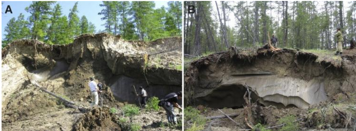
図 2 永久凍土の断面図。地下に氷楔とよばれる地下氷が存在していることがわかる。A の氷の大きさは 8m の幅が 40m の深さ。B は 10m の幅が 60m の深さをもつ。この地域の年間降水量は 240mm ほどでモンゴル・ウランバートルとほぼ同じである。この氷が地表の森林を支えている。(論文では Fig.3)