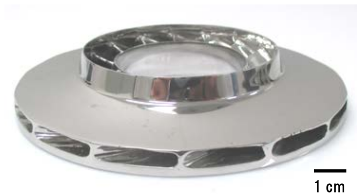
図 2: 試作造形に成功した複雑な形状を有する羽根車