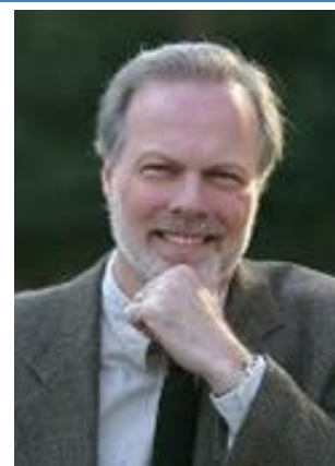
シアトル・パシフィック大学 教授