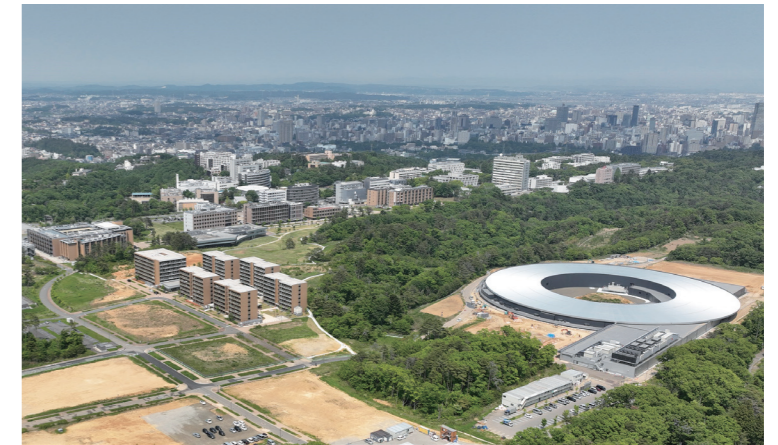
次世代放射光施設 (ナノテラス)

ネクテッドユニバーシティ戦略」を策定しました。サイバー空間を活用して、大学の研究・教育・社会共創の活動領域を一気に拡大していきます。リアルなキャンパスだけでなく、サイバー空間にも東北大学が広がるイメージです。国内外から研究や教育に参加する人が増えてきています。国境や文化、さまざまな障壁を越えて世界に広がる大学を目指しています」(大野氏) リアルな留学が難しかったコロナ禍においては、海外の大学と連携し、オンラインによる国際共修の講義での単位取得も可能とした。