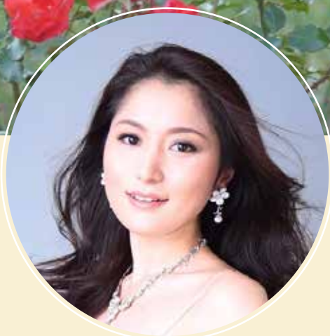
ソプラノ / 斎藤真理