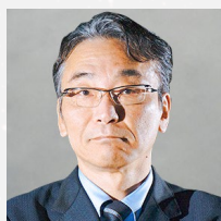
宇宙航空研究開発機構 理事 宇宙科学研究所 所長

また、「多波長を統合した宇宙天文」にてX線からマイクロ波までの観測結果を統合し、地上の天文台も巻き込んで、宇宙138億年の歴史の解明に挑みます。