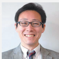
東北大学 流体科学研究所 教授

講演では、火星探査の最新情報、飛行機を使ってできる新しい探査やどうすれば火星で飛行機を飛ばせるかなどの技術的な課題を具体例を紹介しながら説明します。